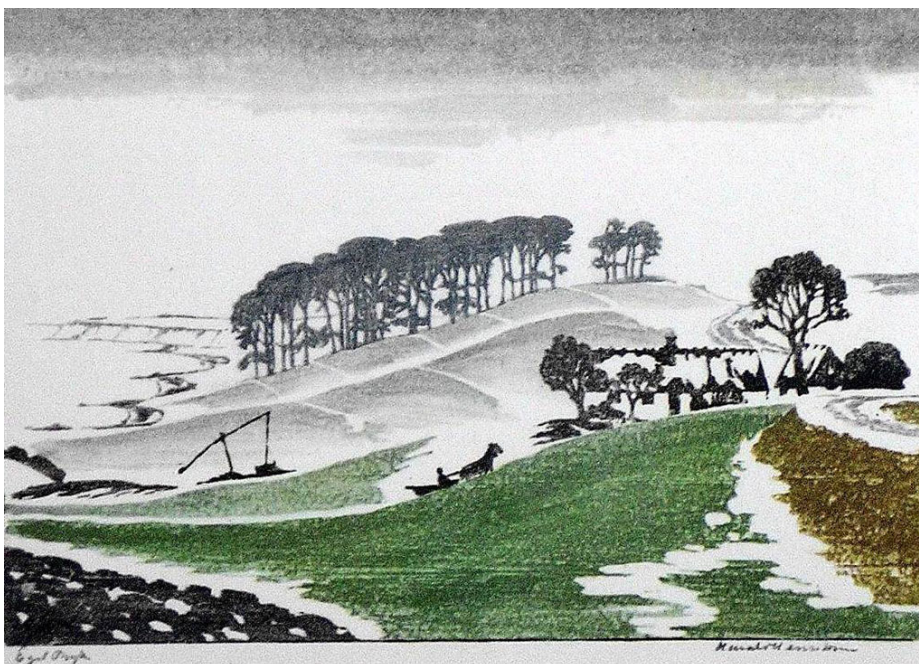
Fra Bramsnæsvig med vippebrønd, 1925, farvetræsnit 29x43