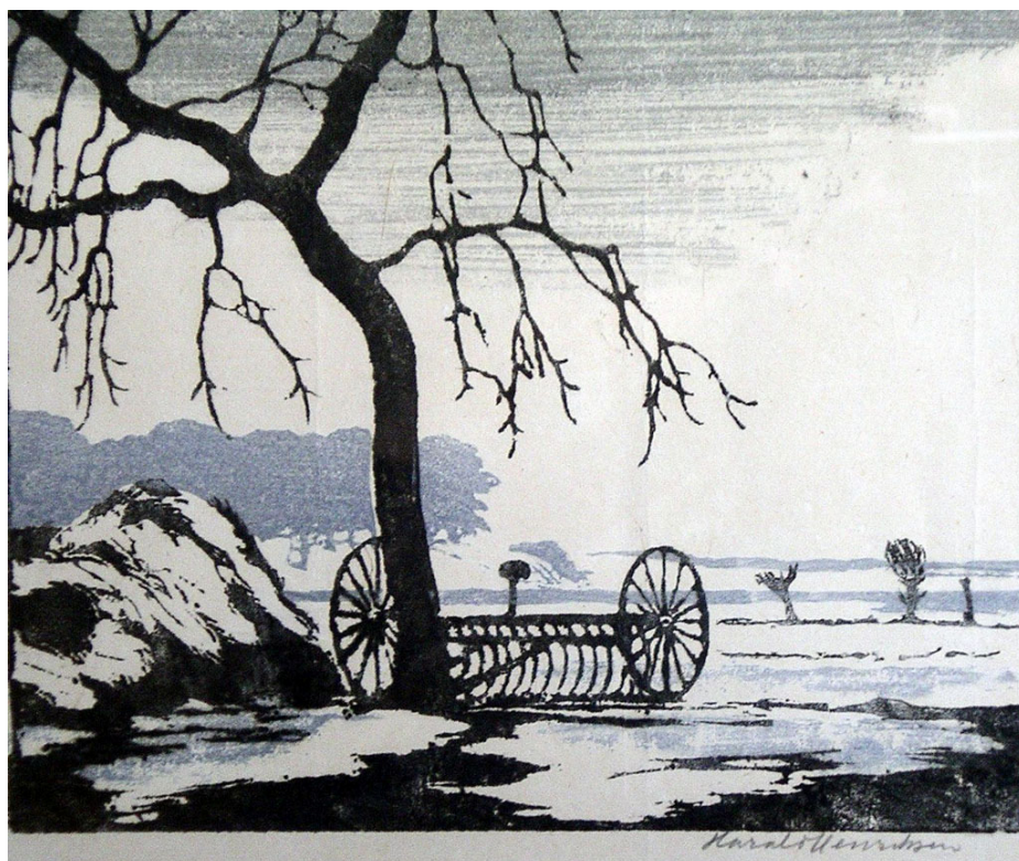
Hesterive, Bramsnæsvig, farvetræsnit 23x27