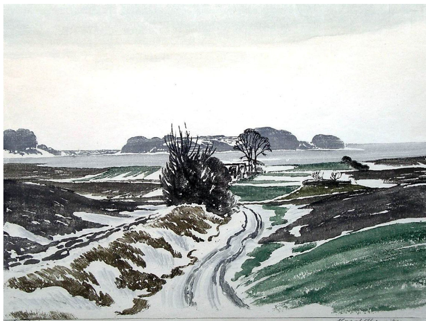
Vinterlandskab ved Bramsnæsvig, ca. 1935, farvetræsnit 38x50