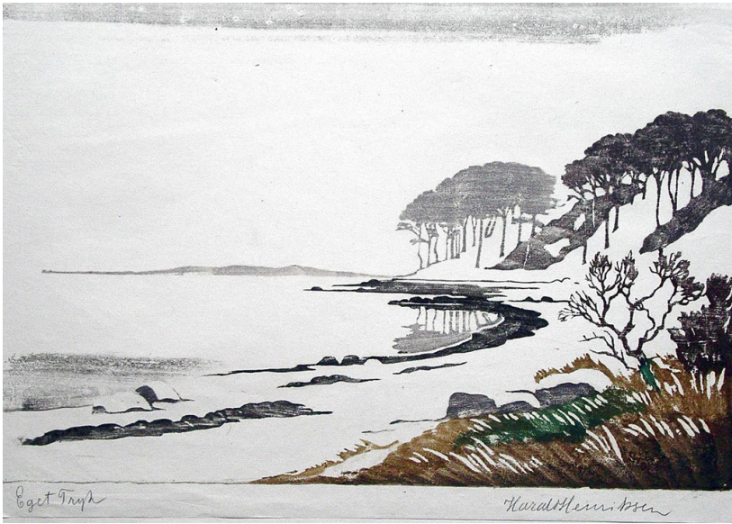
Vinter ved kyst 1924, farvetræsnit 30x44