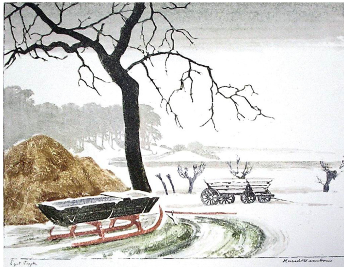
Kane, Bramsnæs vig, farvetrasnit 36x48