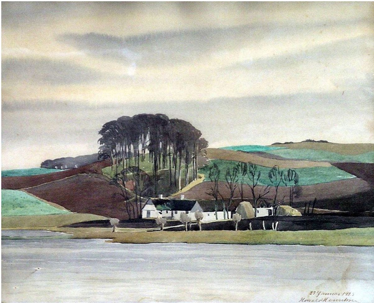
Dejligheden, 25. januar 1925, Akvarel

Læs mere og se træsnit, akvareller og oliebilleder fra andre egne i: