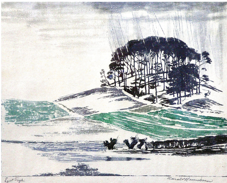
Tøbrud, Bramsnæs vig 1927, farvetrasnit 34x44 cm