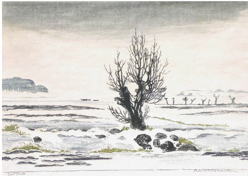
Bramsnæs vig 1927, farvetrasnit 30x43