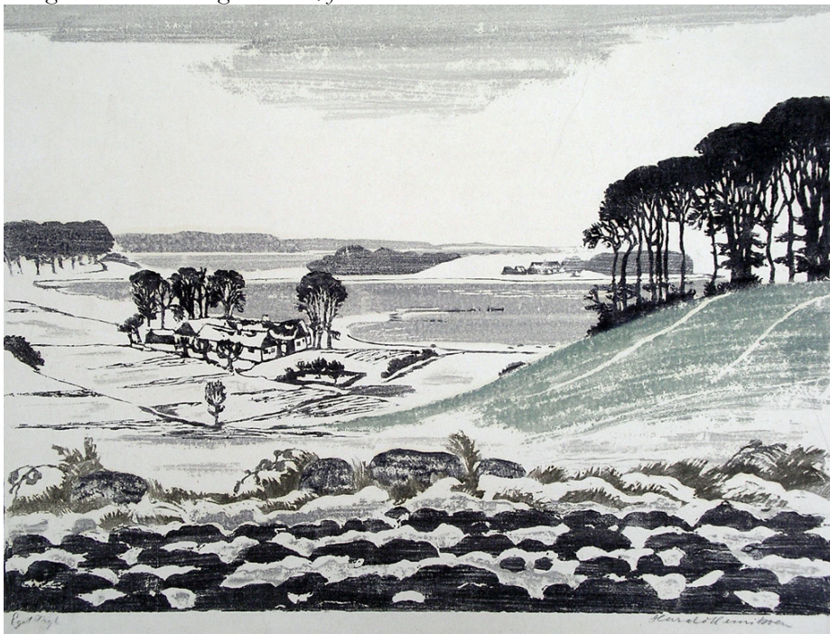
Udsigt over Bramsnæs vig ca. 1928, farvetræsnit 36x48